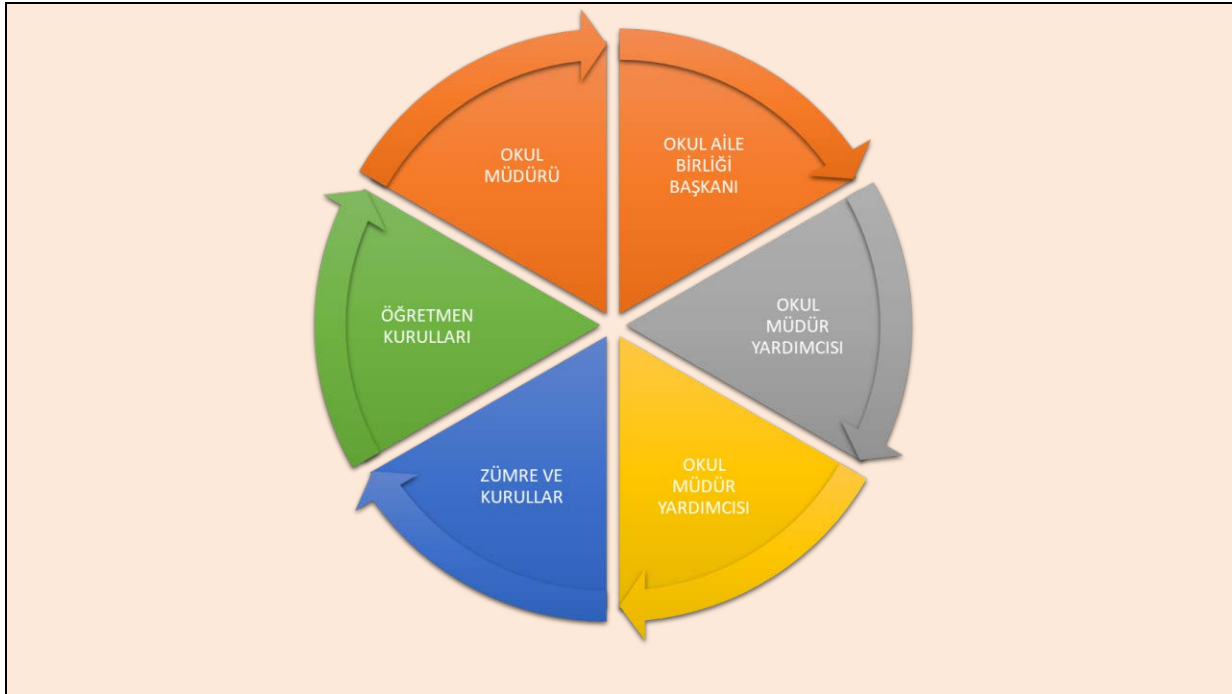
Şekil 1: İç paydaşlar

Paydaş anketlerine ilişkin ortaya çıkan temel sonuçlara altta yer verilmiştir